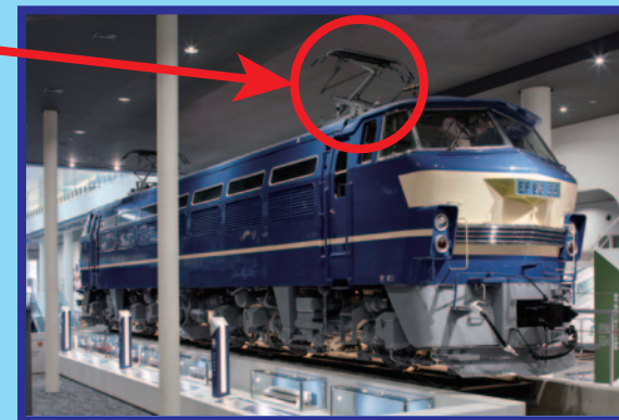
EF66 形電気機関車 ほかにどのような部品がついているかな？