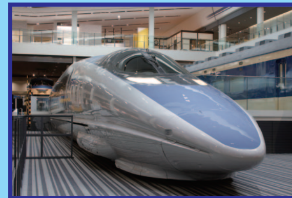
1996 (平成 8) 年に登場して、 今も「こだま」として走っているね