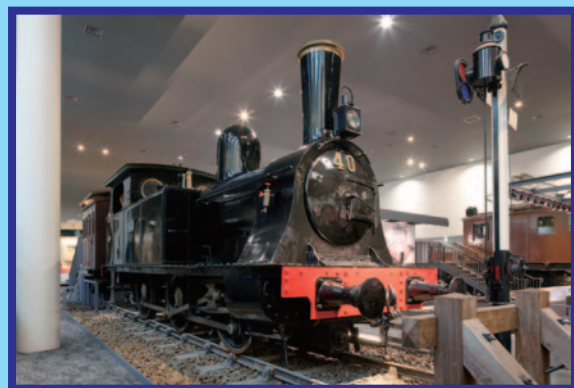
1800 形蒸気機関車 きゅうな坂道でかつやくしたよ