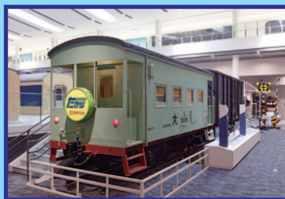
ヨ 5000 形車掌車

こたえを書きおわったら、本館 1 階インフォメーション、または、 本館 2 階 運転シミュレータのカウンターでこたえあわせをしてね！