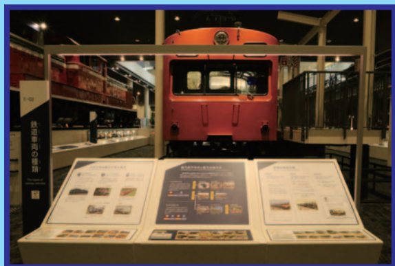
鉄道の車両には、いろいろな種類があるよ！