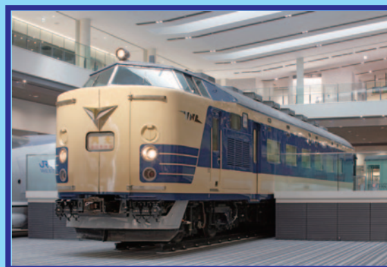
クハネ 581 形電車 まどから車内をのぞいてみよう