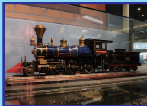
7100 形蒸気機関車。「せんけいしゃこ」に行って「じつぶつ」をみてみよう