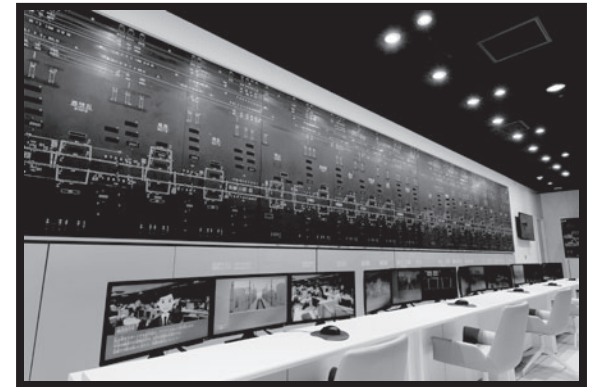
2階で新幹線の運行をコントロールしてみよう！