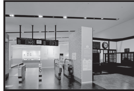
2階のきっぷうりばできっぷを買って、かいさつを通ってみよう！