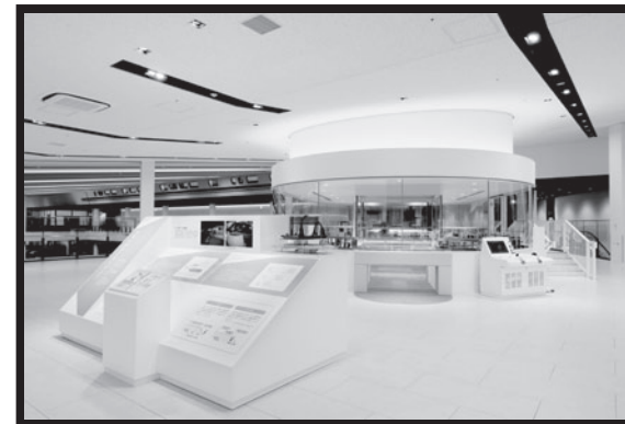
〇ゲーシ模型列車の運転をたのしんで、しくみを学ぼう！

か こたえを書きおわったら、本館1階インフォメーション、または、 ほんかん かい 本館2階 運転シミュレータのカウンターでこたえあわせをしてね！