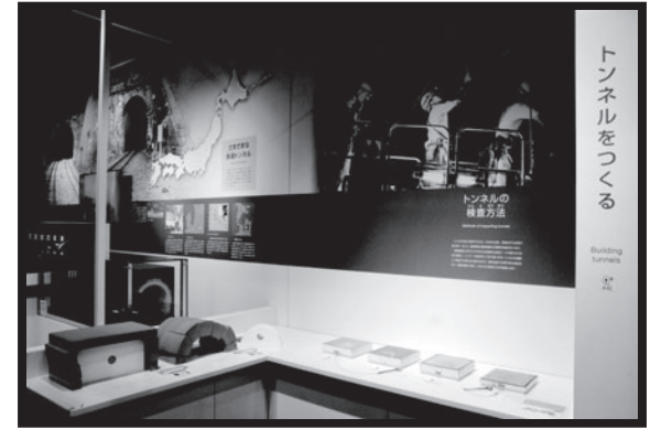
トンネルについていろいろ見てみよう