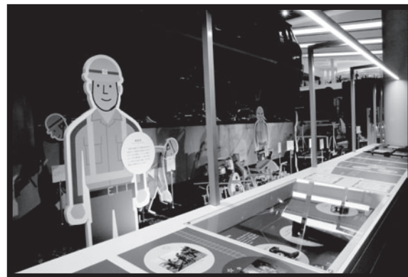
どのような仕事をしているかな？