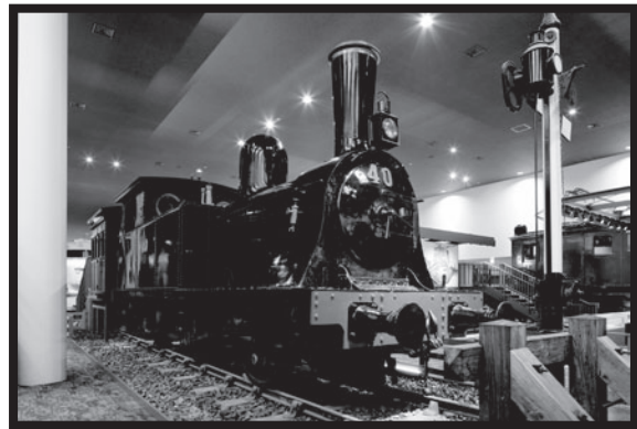
1800形蒸気機関車 きゆうな坂道でかつやくしたよ