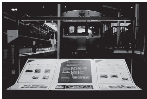
鉄道の車両には、いろいろな種類があるよ！