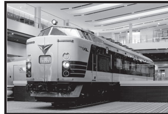
クハネ581形電車 まどから車内をのぞいてみよう