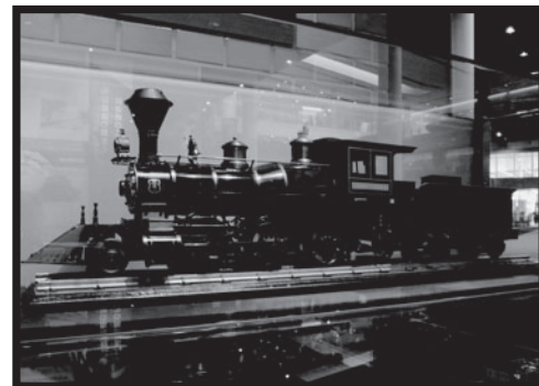
7100形蒸気機関車。「せんけいしゃこ」に行って 「じつぶつ」をみてみよう