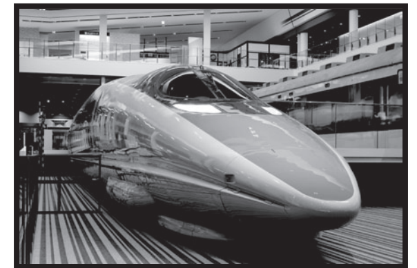
1996(平成8)年に登場して、 今も「こだま」として走っているね