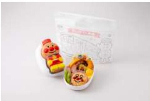
▲アンパンマン弁当 ¥1,250(税込)

会場内の臨時売店にてアンパンマン列車関連グッズを販売します。通常は四国に行かないと購入できない水筒付きの「アンパンマン弁当」と「げんき100ばい!アンパンマン弁当」の2種類(各50個限定)を販売します。その他玩具、雑貨等も販売いたします。