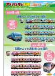
▲パネル展「アンパンマン列車のれきし」