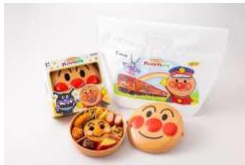
▲げんき100ばい!アンパンマン弁当 ¥1,350(税込)