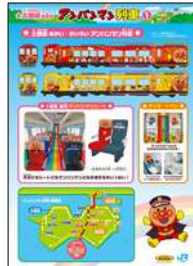
▲パネル展「四国を走るアンパンマン列車」