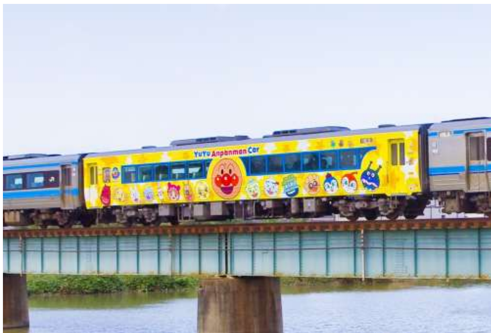
▲ゆうゆうアンパンマンカー