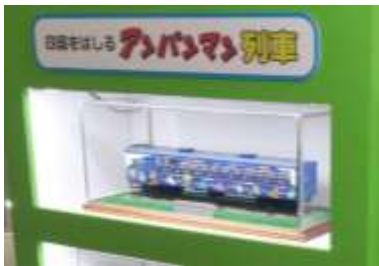
▲イメージ(アンパンマン列車模型)