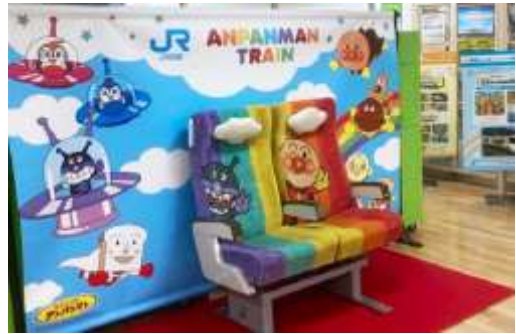
▲イメージ(記念撮影用アンパンマンシート)

車両の前に設置されたステージやアンパンマンシートに座って記念撮影をお楽しみ下さい。