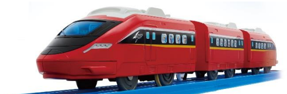
▲「スピードジェット」