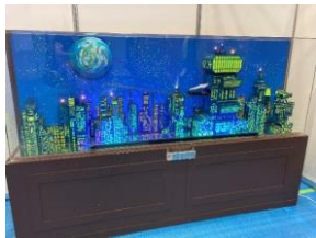
▲メガロポリスのジオラマ(イメージ)

鉄郎、メーテルなどの等身大パネルとTVアニメオープニング映像を放映！ さらに！メガロポリス(999号が出発する駅)のジオラマやTVアニメ放送当時に販売されたグッズを展示します。