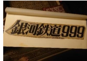
▲左：設定資料展示(イメージ) ▲右：劇場版タイトルロゴ原本(イメージ)