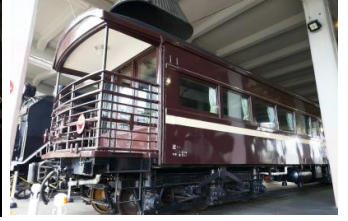
▲ マイテ49形2号車 (劇場版2作目再現)