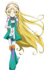
▲月野メーテル等身大パネル(イメージ)

作品紹介パネルや商品を展示します。 また、月野メーテル(シンカリオンZキャラクター)の等身大パネルも設置します。