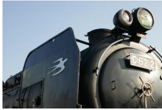
▲ C62形2号機 (劇場版2作目再現)