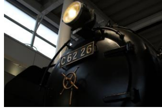
▲ C62形26号機 (TVアニメ版再現)