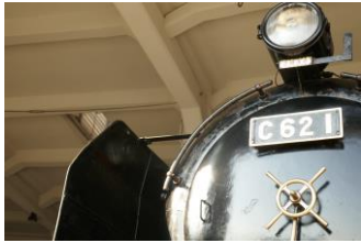
▲ C62形1号機 (劇場版1作目再現)