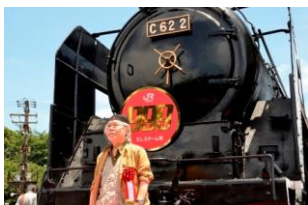
▲松本零士先生が来館されたときの様子(2013年)

京都鉄道博物館の前身である”梅小路蒸気機関車館”で、2013年に開催したイベントの写真やインタビュー映像を上映！また、松本零士先生の足跡をたどるパネルを展示します！