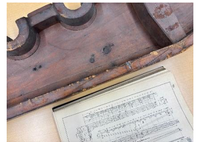
▲D60形蒸気機関車火格子(木型の一部)と図面