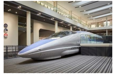
▲500系新幹線電車 521形1号車