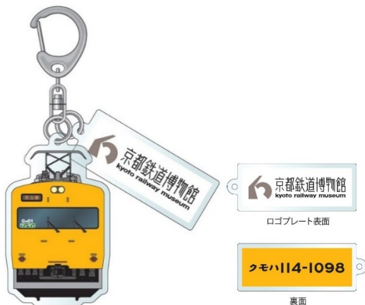
▲アクリルキーホルダー 1,100円(税込)

※輸送上の都合により、展示車両の車両番号と商品デザインの車両番号が異なる場合がございます。