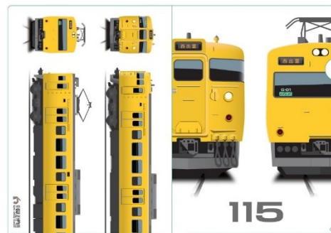
▲A4クリアファイル(イメージ) 550円(税込)

ミュージアムショップ お問い合わせ先：080-3461-5537 (毎営業日：10時～17時)