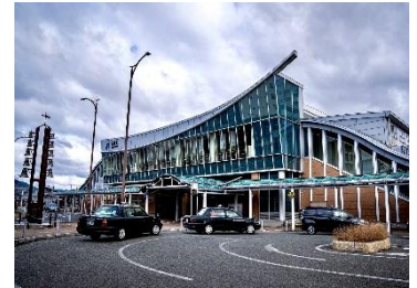
▲嵯峨野線(山陰線)亀岡駅南口