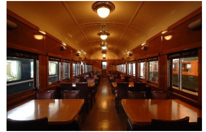
▲スシ 28 形 301 号車