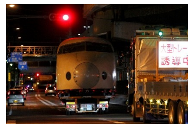
▲弁天町を後にする 0 系新幹線電車