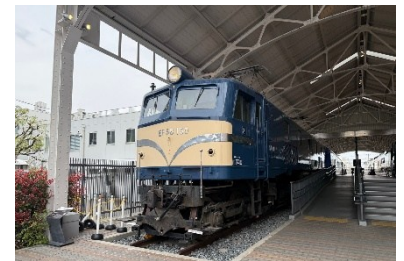
▲EF58 形 150 号機