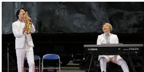
▲過去に開催した様子