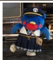
▲公式キャラクター ウメテツ