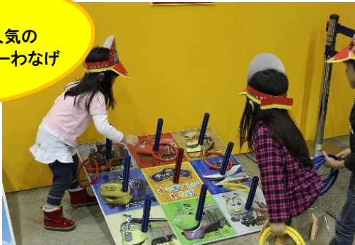
⑤チャギントンわなげ