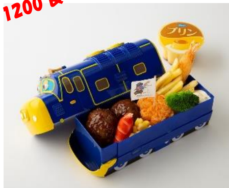
▲「チャギントン弁当 ランチBOX付き ブルースター」 1,900円(税込)