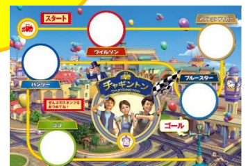
▲スタンプ台紙(イメージ)

本館内5ヶ所にスタンプを設置します。 スタンプ台紙は、本館1F 500系新幹線電車 付近に設置します。 本館内をまわってウィルソンたちのスタンプを 集めよう!