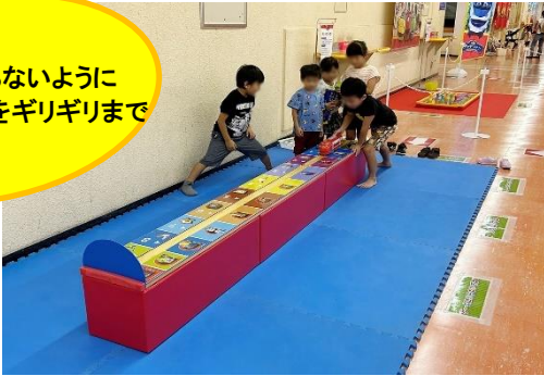
③ストップチャガーゲーム