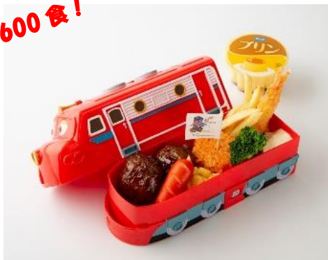
▲「チャギントン弁当 ランチBOX付き ウィルソン」 1,900円(税込)