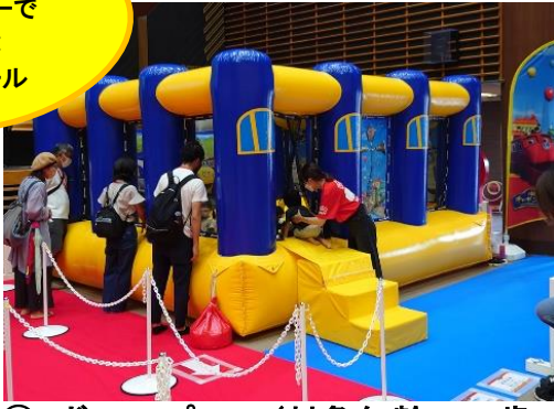
① ボールプール(対象年齢：3歳～)