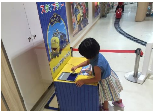
⑦チャギントンスタンプラリー

本館内5ヶ所にスタンプを設置します。 スタンプ台紙は、本館1F 500系新幹線電車 付近に設置します。 本館内をまわってウィルソンたちのスタンプを 集めよう!