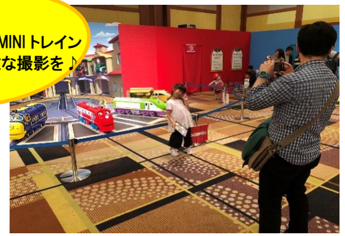
⑥チャギントン MINI トレイン 転車台フォトスポット