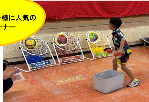
④チャギントン玉入れ