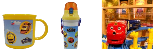
▲左：チャギントン食洗機対応プラコップ 495円(税込) 中央：チャギントン食洗機対応プラボトル 1,760円(税込) 右：おかでんチャギントンプラレール 2,970円(税込)

ミュージアムショップ お問い合わせ先：080-3461-5537 (毎営業日：10時～17時)