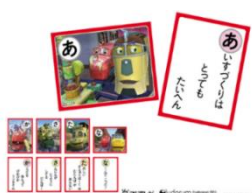
▲チャギントン かるた 1,210円(税込)