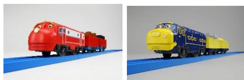
▲左上：チャギントンプラレール ウィルソン 右上：チャギントンプラレール ブルースター 左下：チャギントンプラレール ココ 各3,190円(税込)