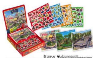
▲チャギントン ワクワクシールボックス 1,518円(税込)