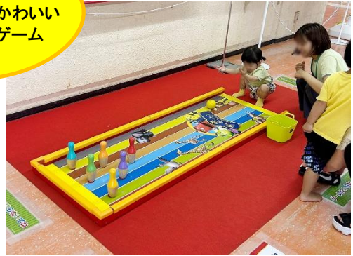
②チャギントンボウリング