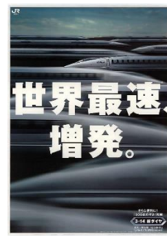
▲ ポスター「世界最速増発。」(1998年)