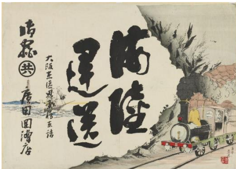
▲ 引札「海陸運送」明治期