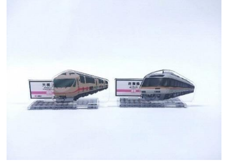
▲KTR8500形、タンゴ・エクスプローラー アクリルスタンド 各1,000円(税込)