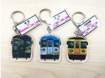
▲駅名看板付きアクリルキーホルダー (全13種+シークレット1種) 500円(税込) ※カプセルトイにて販売