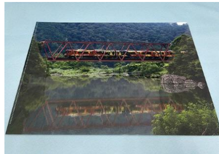
▲(水鏡)クリアファイル 550円(税込)