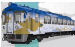
▲「海の京都トレイン」 (KTR801)