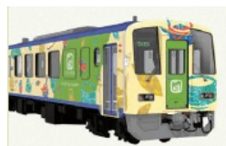
▲「お茶の京都トレイン」 (キハ120形)