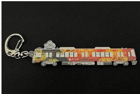
▲アクリルキーホルダー 770円(税込)