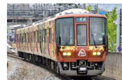
▲「森の京都 QR トレイン」 (223系)