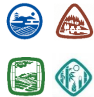
▲スタンプイメージ