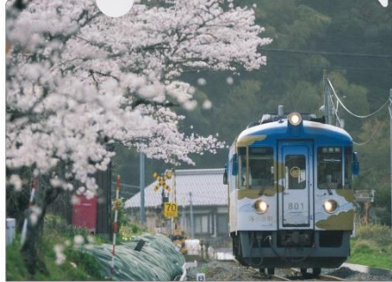
▲海の京都トレイン クリアファイル 400円(税込) ※200枚限定