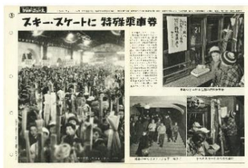
▲トラベルフォトニュース 「ニュース通巻78号スキー・スケートに特殊乗車券」