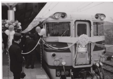
▲特急「くろしお」出発式 (1965年)