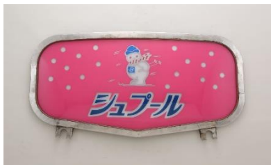
▲列車愛称板「シュプール」