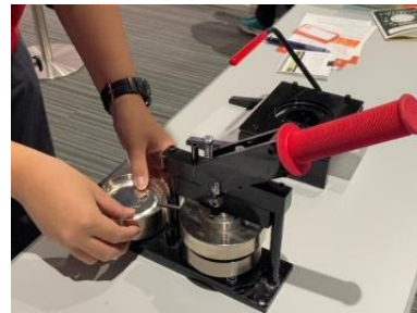
▲過去に開催した様子(イメージ)