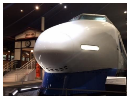
▲100系新幹線電車122形5003号車