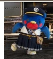
▲公式キャラクター ウメテツ