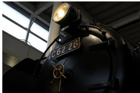
▲プロムナードのC62形26号機