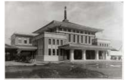
▲2代目奈良駅(昭和8年頃)