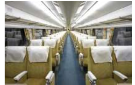
▲0系新幹線電車16形1号車