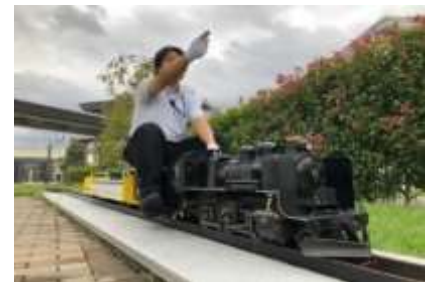
▲実物の1/8サイズのSLが走行！