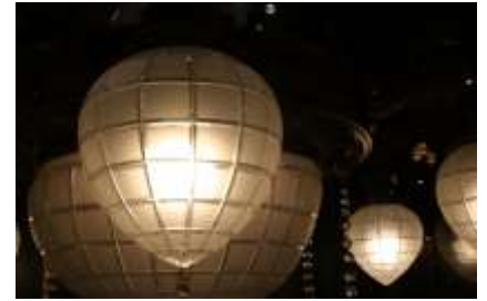
▲2代目京都駅貴賓室の シャンデリア(昭和20年代)