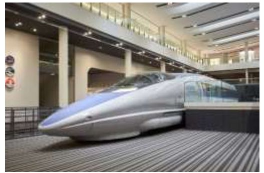
▲500系新幹線電車 521形1号車