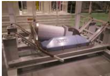
▲寝ているパンタグラフが・・・