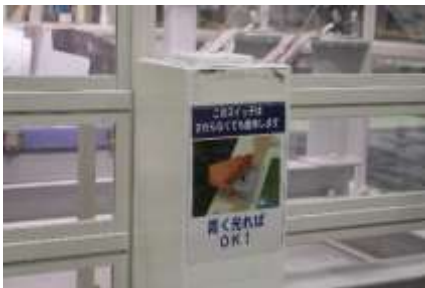
▲非接触センサーだから安心！

当館には、非接触型センサー式で、500系新幹線電車のパンタグラフの動きが分かる展示もあります！ 本館1F 「車両のしくみ」エリアまで来てね♪