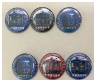
京都丹後鉄道 オリジナル缶バッジ (非売品) (いずれか 3 個、デザイン選択不可)