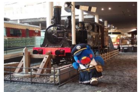
▲公式キャラクターウメテツ