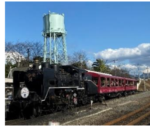
▲プロムナードのC62形26号機(左) SLスチーム号(右)