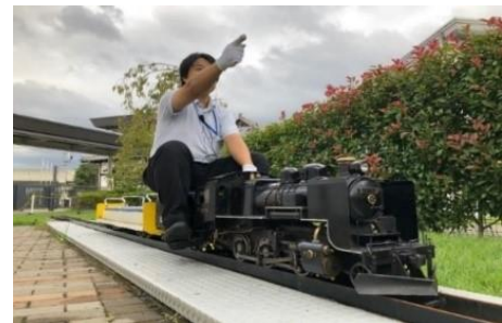
▲本物と同じ仕組みで動く！