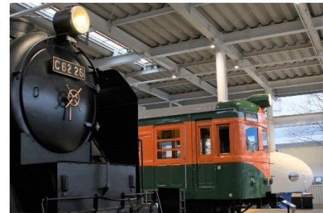
▲エントランスでお客様を迎える3両