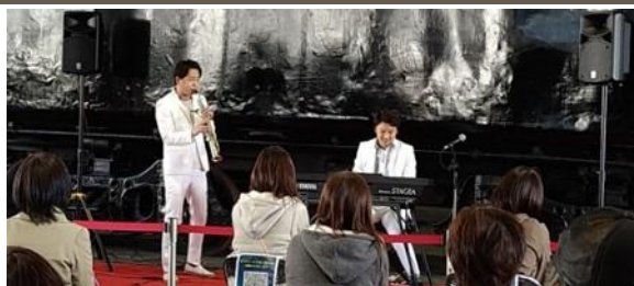
▲過去に開催した様子