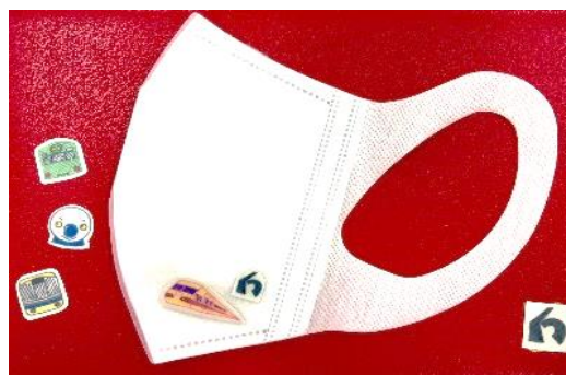
▲自分だけのオリジナルマスクシールが作れます！