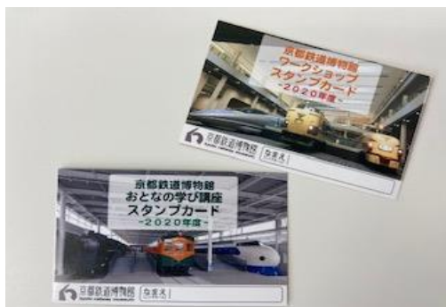
▲スタンプカード (イメージ)