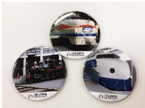
▲缶バッジ (イメージ)