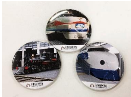
▲缶バッジ (イメージ)