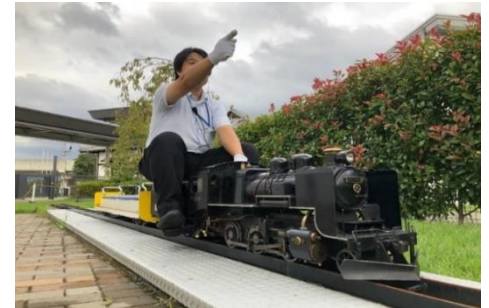
▲本物のSLと同じ仕組みで動くミニSLがけん引する客車に乗車できます。