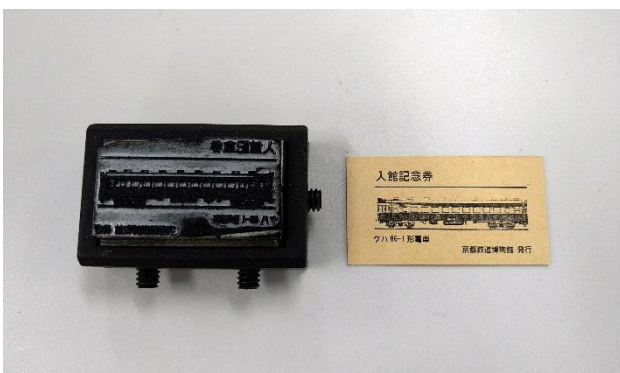
▲どんなデザインかな？ ヒント：今年、誕生70周年を迎える アノ車両♪