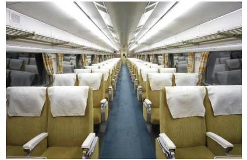
▲「0系新幹線電車16形1号車」車内