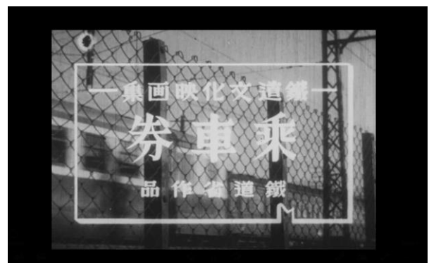
▲収蔵映像で昔の切符について解説！