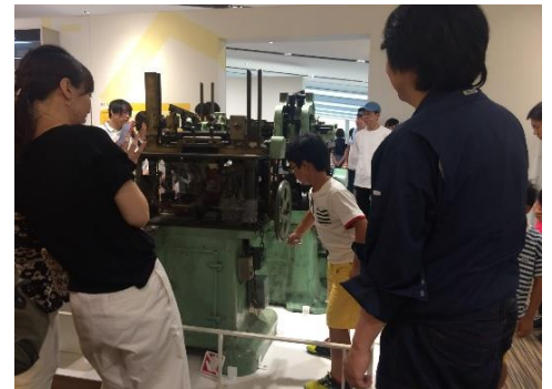
▲本物の硬券印刷機を動かしてみよう！