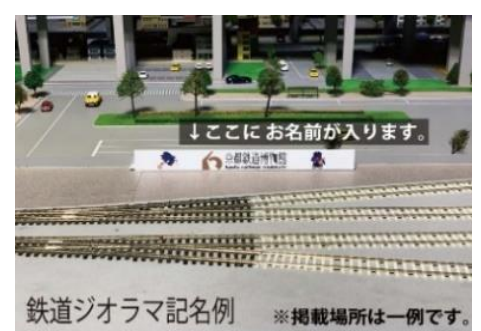
▲鉄道ジオラマ内看板記名 (イメージ)