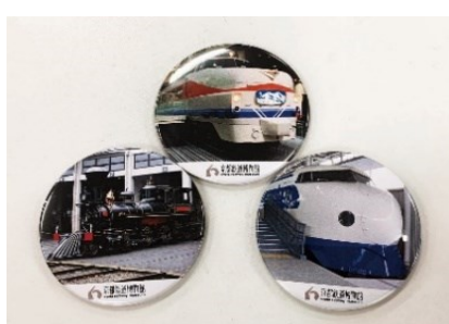
▲缶バッジ (イメージ)