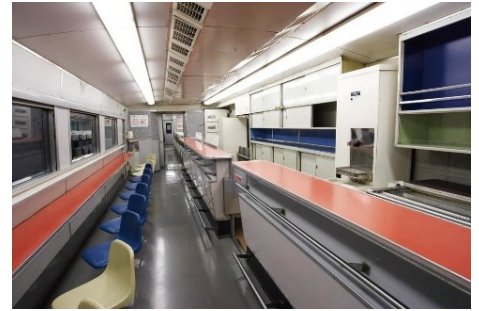
▲0系新幹線電車 35形1号車車内

開催日 10月の土曜日・日曜日 開催時間 10:00~16:30 開催場所 プロムナード