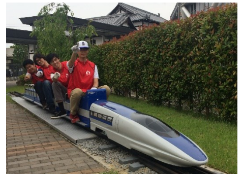
▲ミニ500系新幹線電車がけん引する客車に乗車できます。

開催日 10月25日(日) 開催時間 10:30~16:30(12:00~13:30は休止) 開催場所 プロムナード横 ミニ列車のりば 参加料 無料 ※要入館料 参加方法 随時運転 ※雨天時は中止します。