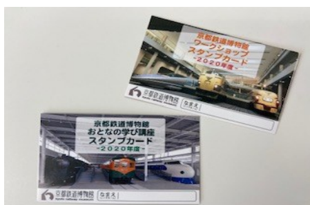
▲スタンプカード (イメージ)