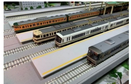
▲特別プログラムで活躍する模型列車たち(イメージ)