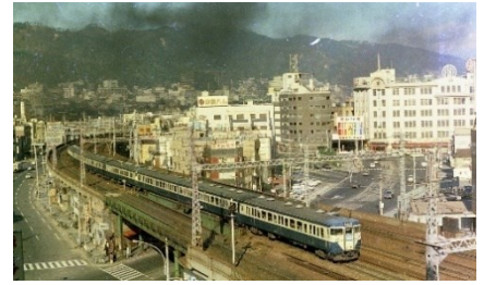
▲初代新快速に使用された113系電車(1971年撮影)