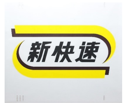
▲117系電車 運行標識幕