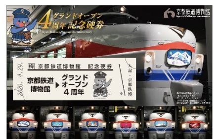
▲4周年記念硬券(イメージ)