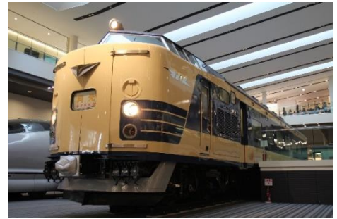
▲ クハネ 581 形 35 号車

開催日 9月の土曜日・日曜日・祝日 開催時間 10:00~16:30 開催場所 本館 1 階