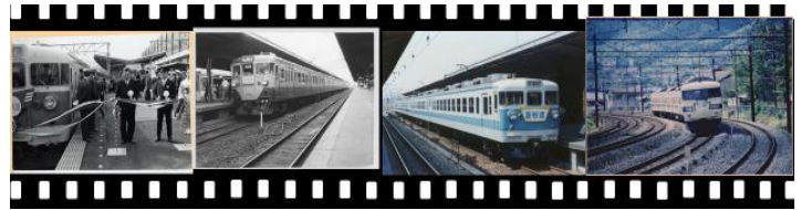
▲画像はイメージです