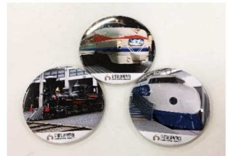
▲缶バッジ・缶マグネット(イメージ)