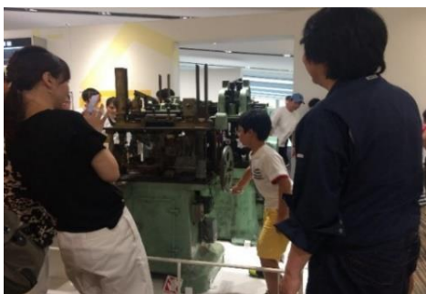
▲展示品解説セミナー 「硬券印刷機」