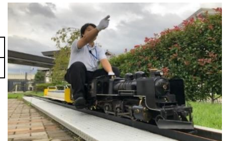
▲本物の SL と同じ仕組みで動くミニ SL がけん引する客車に乗車できます。

開催時間 10:30~16:30(12:00~13:30 は休止) 開催場所 プロムナード横 ミニ列車のりば 参加料 無料 ※要入館料 参加方法 随時運転 ※雨天時は中止します。