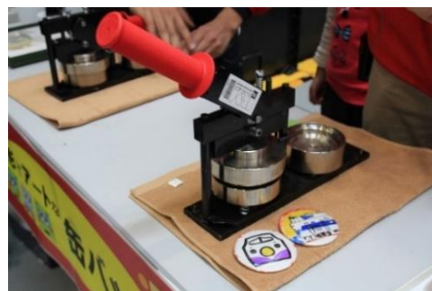
▲子ども工作教室 「缶バッジ制作」開催時のようす