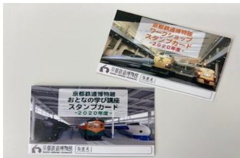
▲リニューアルした2種類のスタンプカード(イメージ)