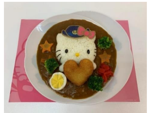
▲ハローキティ新幹線 カレーライス

※尚、新型コロナウイルス感染症対策のため、レストランの座席数を削減させていただきます。予めご了承くださいませよう、お願い申し上げます。