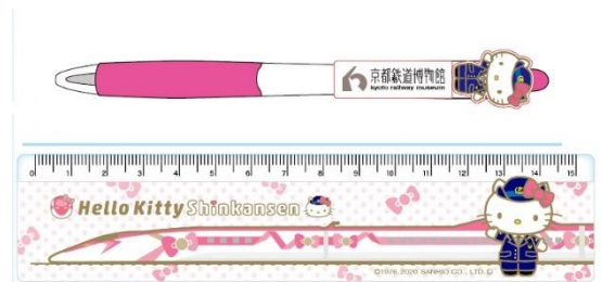
▲グッズ(ボールペン・定規)