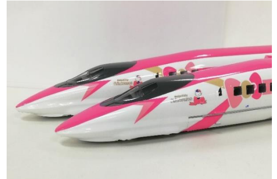
▲「ハローキティ新幹線」仕様ラッピングの500系新幹線模型

※鉄道ジオラマは、当面の間、通り抜けでのご見学とさせていただきます。ご理解賜りますようお願い申し上げます。