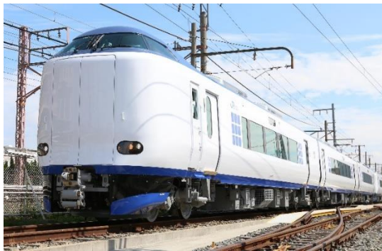
271系 (展示車両にはラッピングされています)