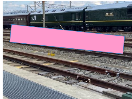
展示場所 ※画像はイメージです