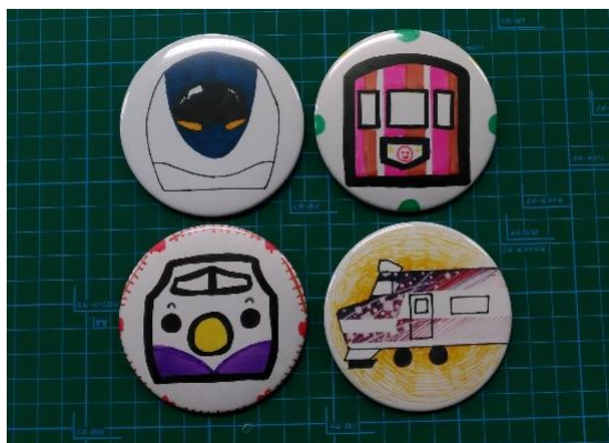
▲オリジナルトレイン缶バッジ(イメージ)