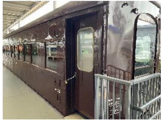
▲スシ 28 形 301 号車

開催日 3月の土曜日・日曜日・祝日 開催時間 10:00～16:30 場所 プロムナード 参加料 無料 ※要入館料