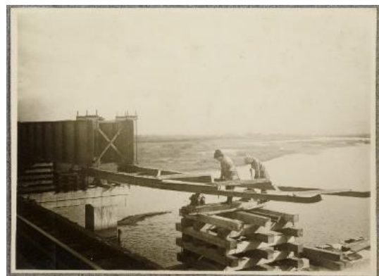
▲下神崎川橋梁架設工事写真(大阪駅～尼崎駅間) 1926(大正15)年

開催日 4月4日(土)～7月12日(日) 場所 本館3階 ギャラリー 展示資料 下神崎川橋梁架設工事写真 等