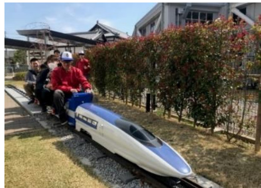
▲実物の約1/8サイズのミニ 500 系新幹線

開催日 3月29日(日) 開催時間 10:30～12:00、13:30～16:30 場所 プロムナード横 ミニ列車のりば 参加料 無料 ※要入館料 参加方法 随時運転 ※雨天時は中止とさせていただきます。