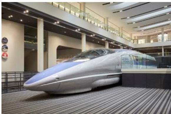
500系新幹線先頭車両(521形1号車)