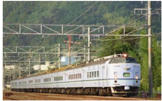
「シュプール&リゾート色」

かつて、1980年代から90年代のスキーブームに合わせて、関東地区や関西地区から、主に信越方面への専用列車として、「シュプール号」が設定された。関西地区からの設定では、1986（昭和61）年度から581系を使用した列車の運転を開始した。1992（平成4）年から「シュプール&リゾート色」として専用の色が採用されたが、1997（平成9）年には、再度別の色に変更され、わずか5年のみ採用された塗装となった。