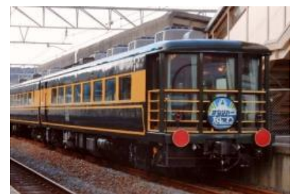
▲14系客車「サロンカーなにわ」