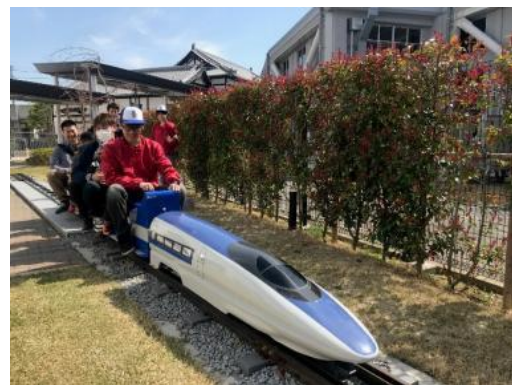
▲レール幅が5インチ(127mm)、実物のおよそ1/8サイズのミニ500系新幹線が走ります！