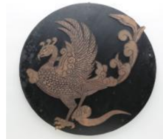
▲D51形838号機の除煙板に取り付けられた鳳凰の装飾(1971(昭和46)年)