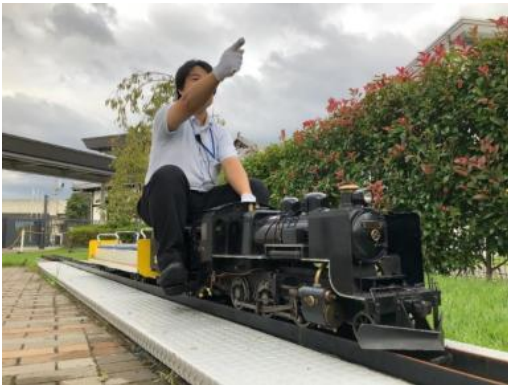
▲本物のSLと同じ仕組みで動くミニSLがけん引する客車に乗車できます。

開催場所 プロムナード横 ミニ列車のりば 開催時間 ①10:30～12:00(※受付終了12:00) ②13:30～16:30(※受付終了16:30) 参加料 無料 ※要入館料 参加方法 随時運転 ※雨天時は中止とさせていただきます。