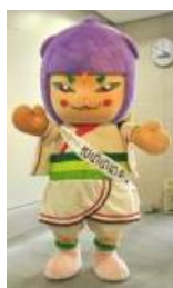
橿原市 「さららちゃん」