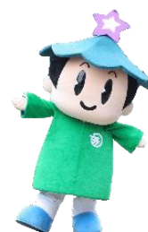
五條市 「ゴーちゃん」