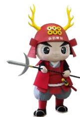
九度山町 「ゆきむらさま」