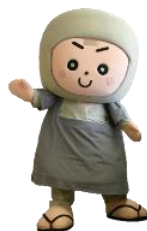
岩出市 「そうへいちゃん」