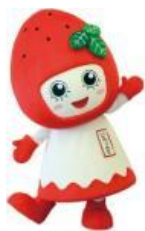
紀の川市 「いちごっふる」