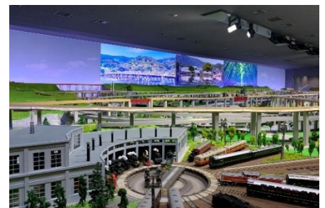
▲画像はイメージです

内容 実物の約80分の1(新幹線電車は87分の1)サイズの様々な鉄道模型車両(HOゲージ)が、京都から鉄道の旅に出かけるストーリーをテーマにした映像に合わせてジオラマ上を走行します。