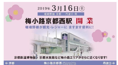
▲画像はイメージです

内容 「梅小路京都西駅」前広場で開催される開業記念イベントに、3月9日(土)より開催する「おかげさまで60年まるごとプラレール展」のミニ展示としてプラレールジオラマを出張展示します。