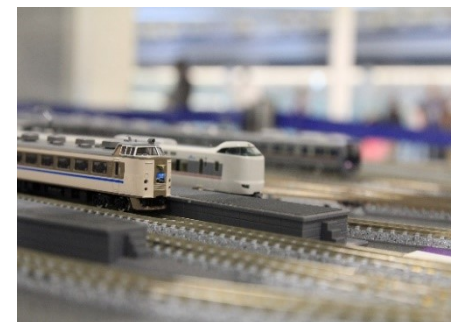
▲画像はイメージです