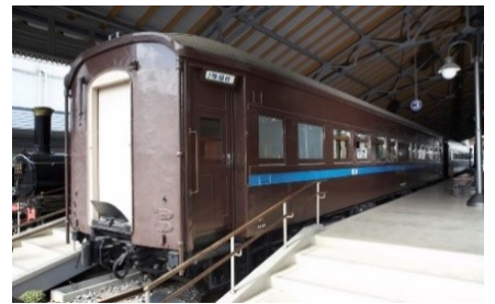
▲マロネフ 59 形 1 号車

開催日 10月の土曜日・日曜日・祝日 時間 ①10:00～12:00 ②13:30～16:30 場所 プロムナード