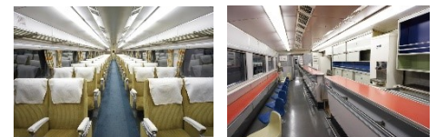
▲左0系16形1号車(グリーン車)