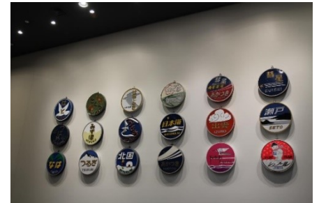
▲写真はイメージです。

内容 企画展のテーマに合わせたヘッドマークのスタンプラリーを実施！懐かしの特急ヘッドマークのスタンプを4種類ゲットすると、オリジナルヘッドマークシールをプレゼント！