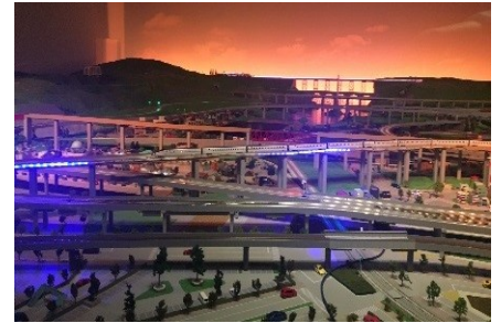
▲画像はイメージです。