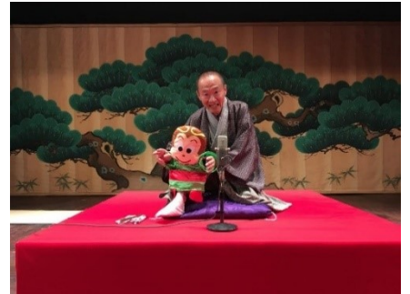
▲パペット(人形)を片手に落語を披露する笑福亭鶴笑師匠

開催日 11月3日(土・祝)、12月15日(土)、2019年1月12日(土) 開催時間 ①13:00～ ②15:30～(各回約30分) 場所 本館3階ホール 出演者 笑福亭鶴笑(しょうふくてい かくしょう) http://kakushow.sakura.ne.jp/index.html 内容 企画展と連動した、「旅」をテーマとした寄席。子どもも楽しめる、人形を駆使したパペット落語をご披露いただきます！