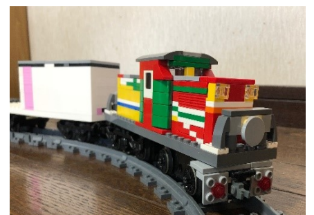
▲ブロックで作った貨車を牽引して走行する機関車(イメージ)