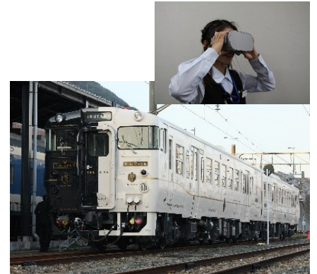
▲指宿のたまて箱