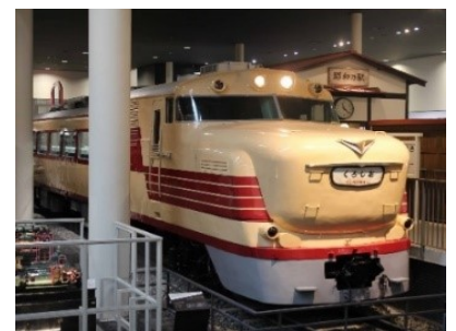
▲キハ 81 形 3 号車

開催日 11月の土曜日・日曜日・祝日 時間 ①10:00～12:00 ②13:30～16:30 場所 本館1階