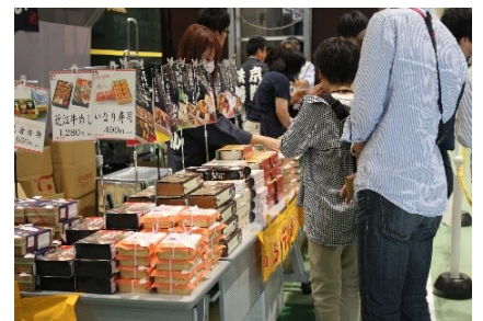
▲写真はイメージです。

開催日 11月3日(土・祝)・4日(日) 時間 10:30～14:00(売切れ次第終了) 場所 本館1階 車両工場 内容 近畿地方の有名駅弁や、当館の人気オリジナル弁当が、あわせて約20種集う大好評の弁当大会です。