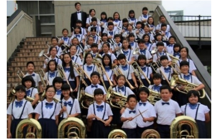
▲五荘小学校金管バンド