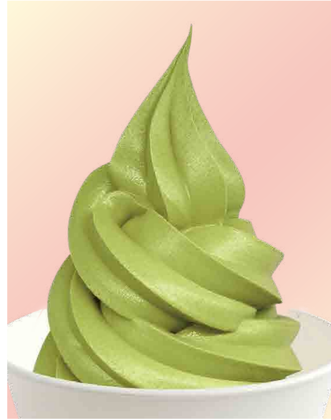
ソフトクリーム抹茶 Matcha 600円