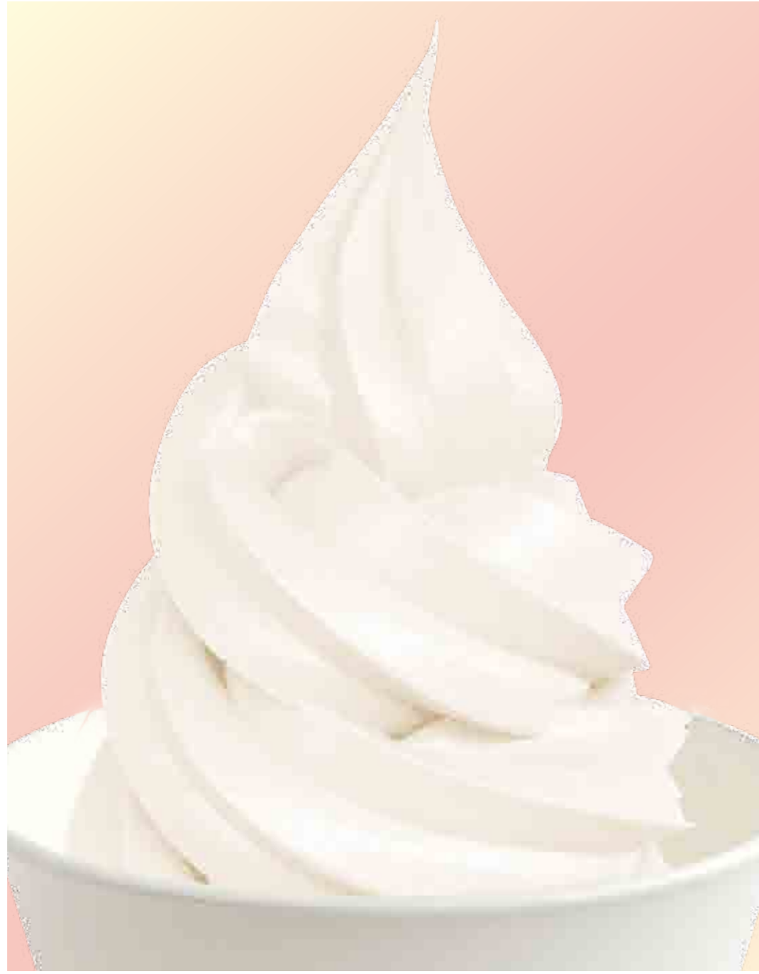
ソフトクリームバニラ Vanilla 600円