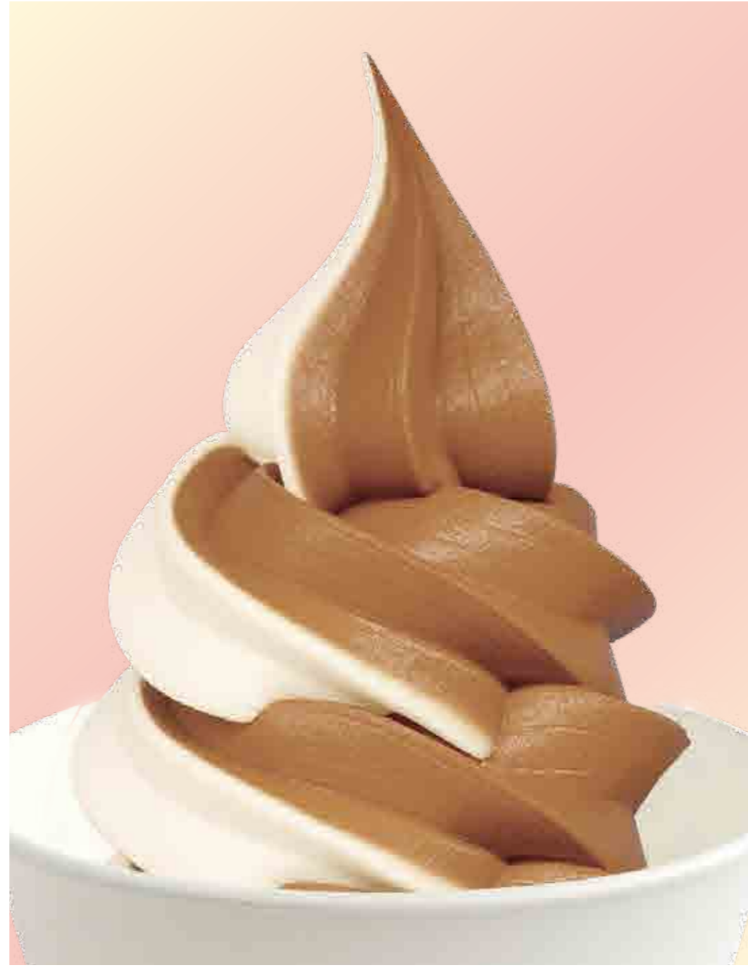
ソフトクリームチョコバニラ Chocolate & Vanilla 600円