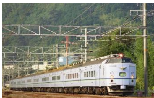
「シュプール&リゾート色」

かつて、1980年代から90年代のスキーブームに合わせて、関東地区や関西地区から、主に信越方面への専用列車として、「シュプール号」が設定された。関西地区からの設定では、1986（昭和61）年度から581系を使用した列車の運転を開始した。1992（平成4）年から「シュプール&リゾート色」として専用の色が採用されたが、1997（平成9）年には、再度別の色に変更され、わずか5年のみ採用された塗装となった。