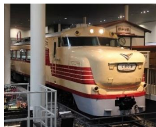
▲キハ 81 形 3 号車