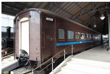
▲マロネフ 59 形 1 号車

各月とも、週末を中心に開催いたします。また、都合により公開車両は変更になることがあります。 (※) 1月は週末に加え、24日(木)・25日(金)・28日(月)・29日(火)も開催します。