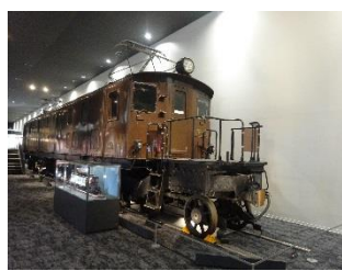
▲E F 52 形 1 号機