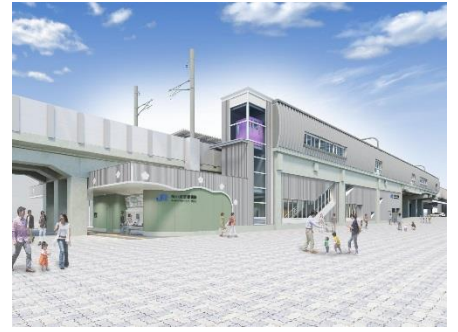
▲梅小路京都西駅のイメージ

京都鉄道博物館では、JR西日本の現役社員が、鉄道の安全性や技術、日々の仕事内容をお伝えする「鉄道おしごと体験」を、週末を中心に開催しております。このたび、建設中の梅小路京都西駅をご見学いただける内容で特別開催します。