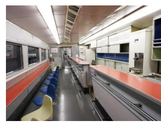
▲0 系 35 形 1 号車