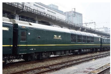
▲オハ 25 形 551 号車