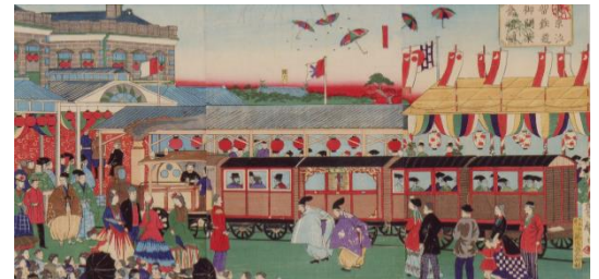
▲東京汐留鉄道御開業祭礼之図 1872(明治5)年 三代歌川広重

開催期間 2018年5月19日(土)～7月16日(月・祝) 会場 本館2階 企画展示室