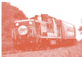
くしろ温泉ノロック号

空前のブームが到来している“観光列車”。乗って、撮って、食べて、遊んで…。大人も子どももワクワクが止まらない最新の観光列車について、本展でしか見ることができない視点から紹介します。