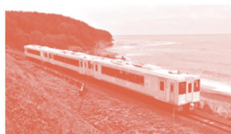
TOHOKU EMOTION