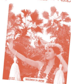
旅行誘致ポスター 「ディスカバー・ジャパン」1975年